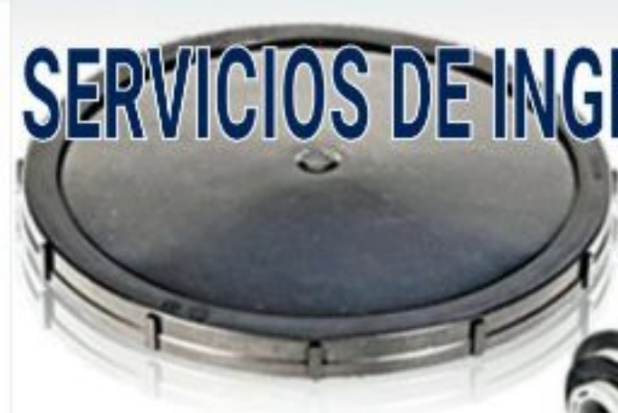
Difusores de Disco