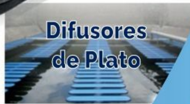
Difusores de Plato