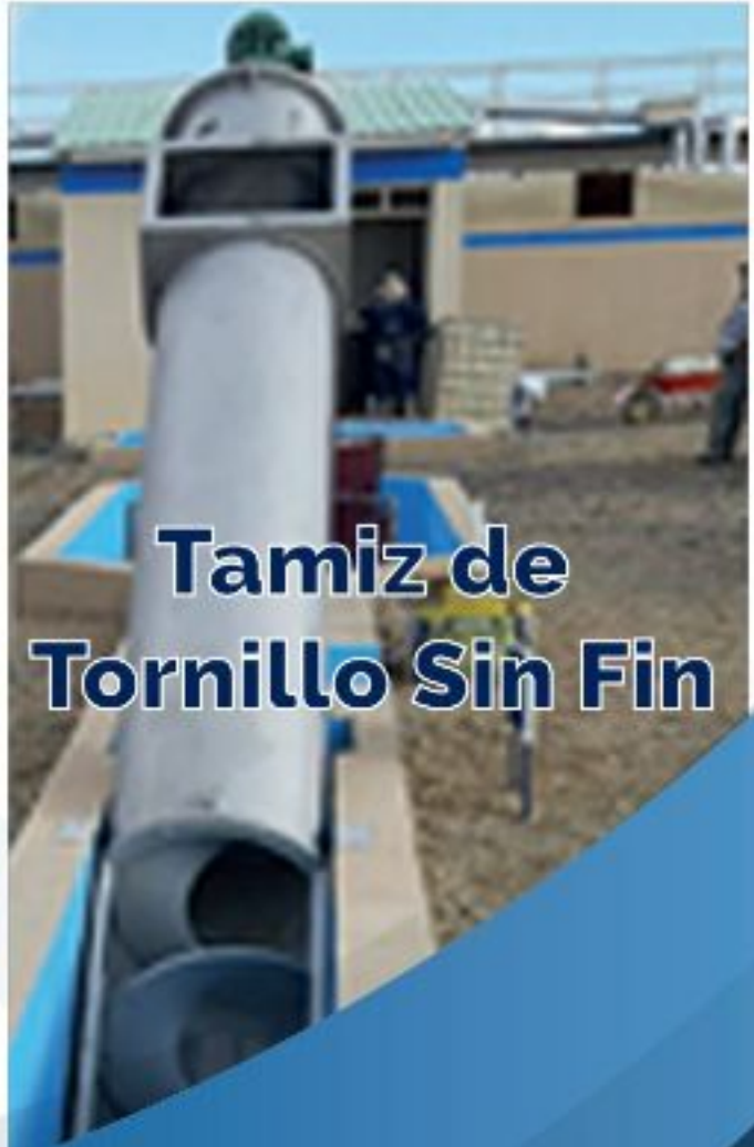
Tamiz de Tornillo Sin Fin